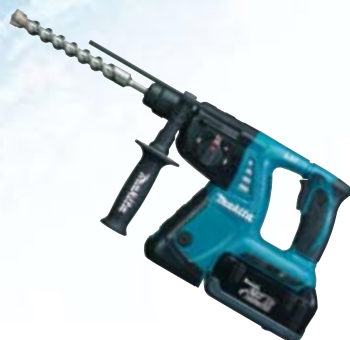
Martillo ligero BHR261T / BHR261