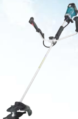
Desbrozador BCC231U / BC231UD