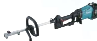
Desbrozador multifunción UX361D