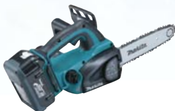
Electrosierra BUC250 / UC250D